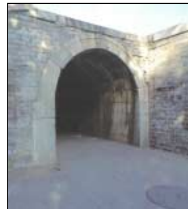
丹陛橋下的鬼門關

皇帝用來獻祭的祭物被牽過鬼門關，帶到宰牲亭。這道門本叫走牲道，位於丹陛橋底下，後來所以被稱為鬼門關是因為在這走過的動物是注定要被宰殺的。沒有一隻備祭的動物可以走在丹陛橋上面。也許古代中國人明白備祭的動物是為我們代罪的。聖經也說無罪的耶穌基督代替我們的罪被釘死於十字架上，第三天從死裏復活戰勝死亡，只有相信祂我們的罪才能得赦免，並得著永生。