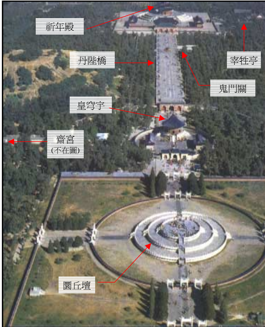
鳥瞰天壇的各主要建築物

天壇位於北京城的東南方。取名為壇本身就強調用血祭來與上帝和好的意義。其中的結構包括了圓丘壇，齋宮，丹陛橋，祈年殿，皇穹宇，和宰牲亭(請看插圖)。就中國各地名勝的旅遊次數而言，只有長城可與天壇相比。