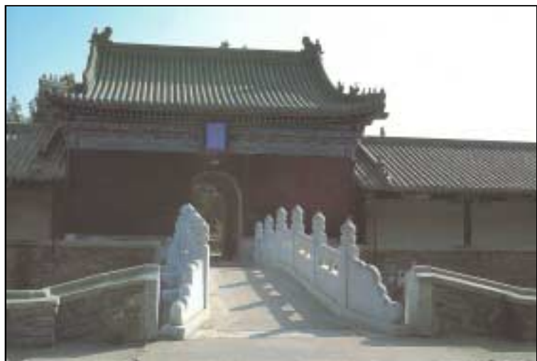
齋宮的前門,皇帝在齋宮 內齋戒三天才去祭天.

西門附近的齋宮是皇帝用來齋戒，反省，靜心的地方。在這裏皇帝齋戒三天才可去祭拜上帝。除了齋戒以外，他不可在此期間作