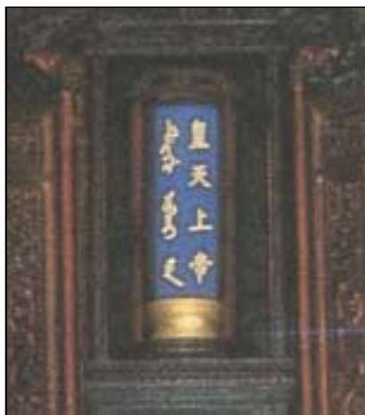
「皇天上帝」牌位用滿漢金字刻寫而成

中國人所認識的全能創造萬物神，滿族人也認識祂為這全能無上的神，因為祂是萬國萬族的神！