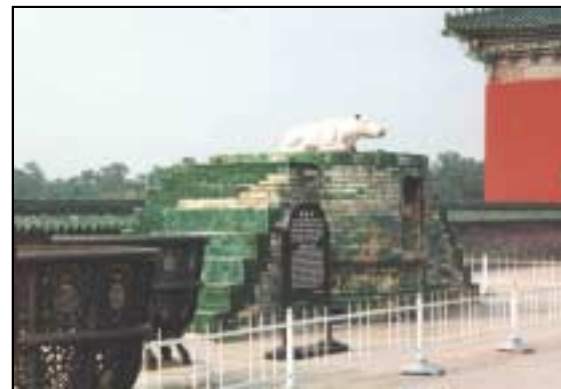
圖示用來燒祭牲畜的燔柴爐

燔柴爐是放在祈年殿的外面，祭品是在宰牲亭內被宰殺和準備好給獻祭用的牲畜，皇帝對這爐內的燒祭行注目禮。今天燔柴爐上有一隻用來獻祭的牛的複製品供遊客作參考。其實早在舜的時代已有燒祭的禮儀。舜在登位之時燒祭物來祭天，但是舜從那兒學得這祭禮呢？