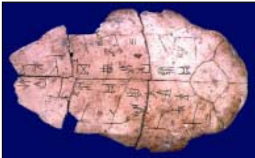
圖示考古學家在上一世紀發掘出商朝其中之一的甲骨文

商朝又叫殷朝，與夏朝不同是書經中所提及商朝的君王，都得到考古學(好比甲骨文)的證實。書經記載商朝人已知這至高無上的上帝是全能的神，祂掌管時分成，定成，分勝負。有些甲骨文存到今天，成為中國最早的文字紀錄。在