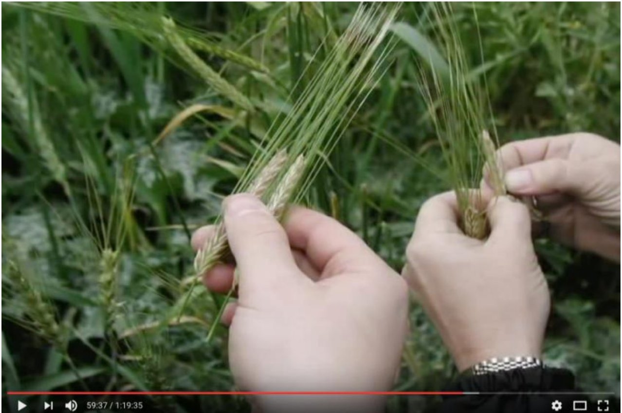
剛吐穗的大麥